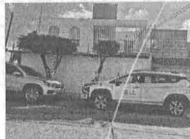
MIERCOLES 03: Traslado para programación de cita médica de PBI en Celaya.