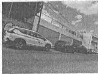
MARTES 09: Traslado niño para seguimiento psicoeducativo en Celaya.

Calle Irapuato s/n, esquina Rosario Castellanos, Col. Guanajuato C.P. 36780. Salamanca, Guanajuato | Tel. 464 6483190