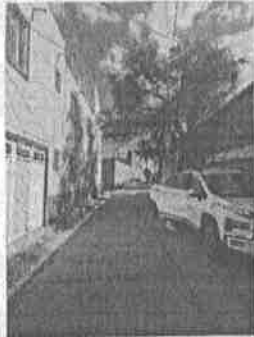
LUNES 08: Valoración Psicológica de adolescente en MP de Guanajuato a Salamanca.