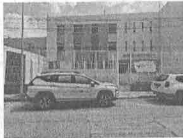
LUNES 01: Traslado de niño en Celaya para atención medica pediátrica en Hospital General de salamanca.