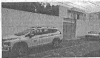
MARTES 02: Traslado de niña para seguimieto neuropediatrco Mac celaya