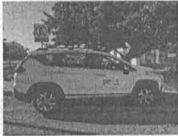
VIERNES 05: Seguimiento a reportes nuevos dentro de Salamanca.