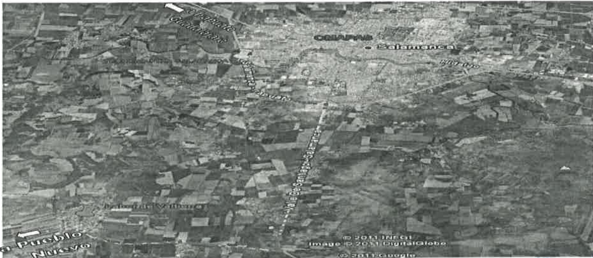
Ilustración 2 Ubicación del relleno sanitario donde se depositarán los lodos de la PTAR Salamanca

El relleno sanitario donde se depositarán los Lodos digeridos de la PTAR se encuentra a 21 Km aproximadamente del terreno de la propia PTAR, al sur del municipio en las cercanías de la Comunidad La Labor de Valtierra, la ruta para llegar a esta comunidad desde la Ciudad de Salamanca es conducir por la carretera estatal a la ciudad de Valle de Santiago para después tomar la desviación al oriente, hacia Pueblo Nuevo, en la siguiente imagen satelital se aprecia la distancia relativa de los dos puntos.